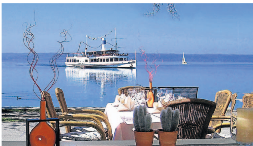
Direkt am Ammersee: das Hotel-Restaurant Promenade.

Art“ mit Kartoffelpüree, Röstzwiebeln und karamellisierten Apfelspalten (15,50 Euro) und Kalbschnitzel mit Röstkartoffeln und Salat (17,90 Euro) finden sich auf der Mittagskarte. Kinder bekommen eine gegrillte Lachsschnitte mit Kartoffeln und Petersilien-Rüben Gemüse (8 Euro). Erfreulich: Ihre Gerichte sind bereits in mundgerechte Stücke geteilt, so dass der Nachwuchs gleich loslegen kann, Bonnes vacances!