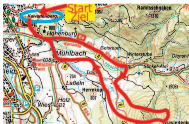
Ausschnitt: Kompass 182, Isarwinkel; Lizenz-Nr. 17-0906-LVB.